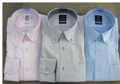
▲ピンク系・グレー系・ブルー系

なお、現在弊社が販売している色柄の「 抗ウイルス加工 」のシャツは上記の白のワイシャツとは異なり、変色の原因となる染料を使用しておりませんので、 これまで通りの取扱いが可能です 。