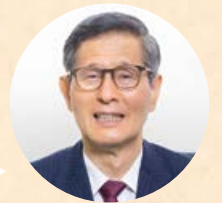
新型コロナウイルス 感染症対策分科会会長

差別や偏見、嫌がらせが広がると医療従事者やエッセンシャルワーカーの離職が増える可能性があります。また、感染者への同様のことが増えると検査を避けたり、感染を隠そうとする人が増え、感染拡大を抑えにくくなります。