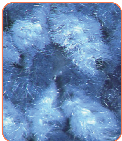
モール糸は、2本の芯糸でパイルを挟み込んだ構造になっている（正常部）

等の付記表示がある場合もあり、クリーニングでの取扱いや利用者への説明資料として有効に活用したい。