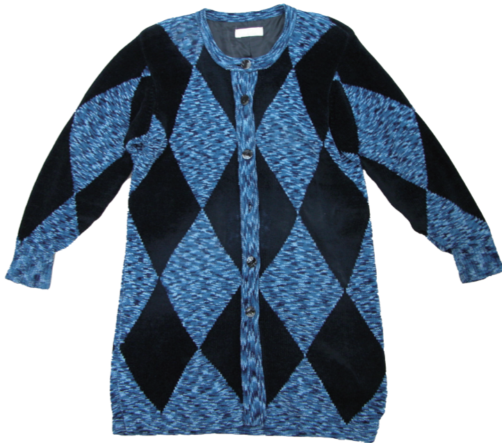
婦人用カーディガン